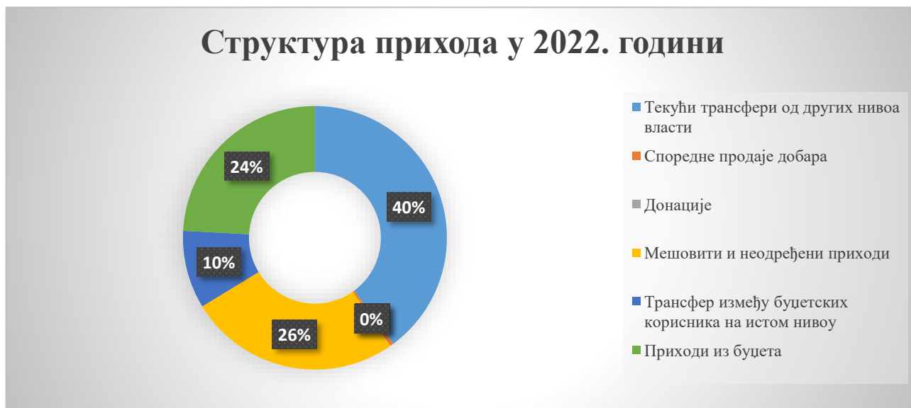
Илустрација 1: Структура прихода према економској класификацији Установе у 2022. години.